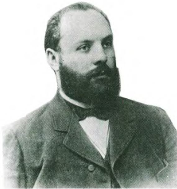
Менахем Мендел Усышкин (1863 — 1941)

эту землю своим потом... Совершенно необходимо, чтобы еврейский народ вошел во владение всей или по крайней мере большей частью земли в Эрец-Исраэль. Без этого права владения Эрец-Исраэль никогда не будет еврейской.